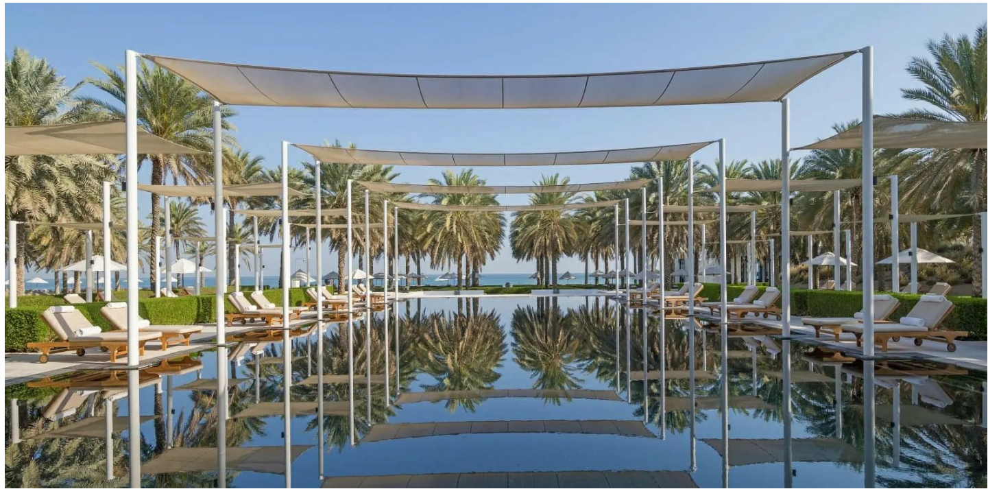
Al Ghubrah Ash Shamaliyyah

Das Luxushotel verzaubert seine Gäste mit erstklassigem Service und der Verbindung fernöstlicher Tradition mit omanischer Gastfreundschaft.