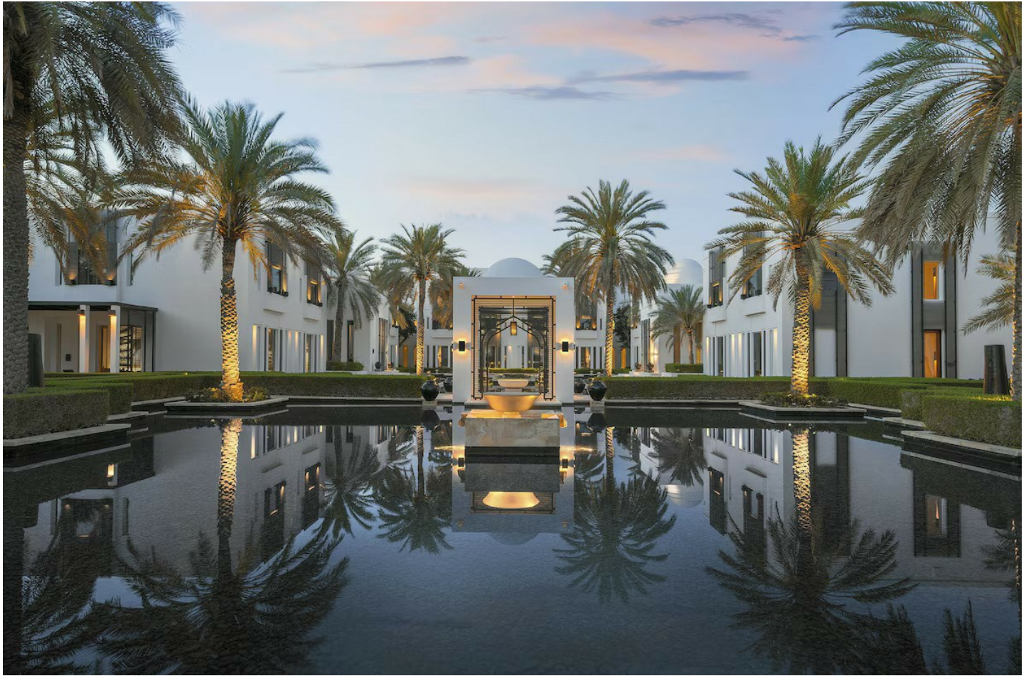
Al Ghubrah Ash Shamaliyyah

Das Luxushotel verzaubert seine Gäste mit erstklassigem Service und der Verbindung fernöstlicher Tradition mit omanischer Gastfreundschaft.