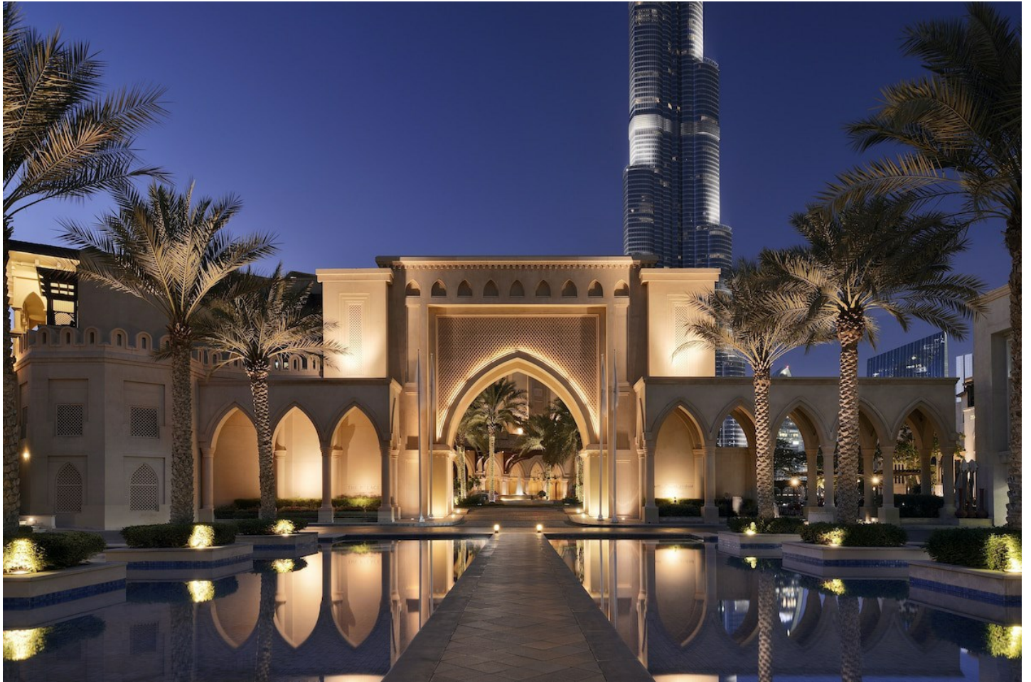
Downtown Burj Khalifa

Das angenehme Hotel an grossartiger Lage bietet wunderbaren Komfort in traumhaftem Ambiente.