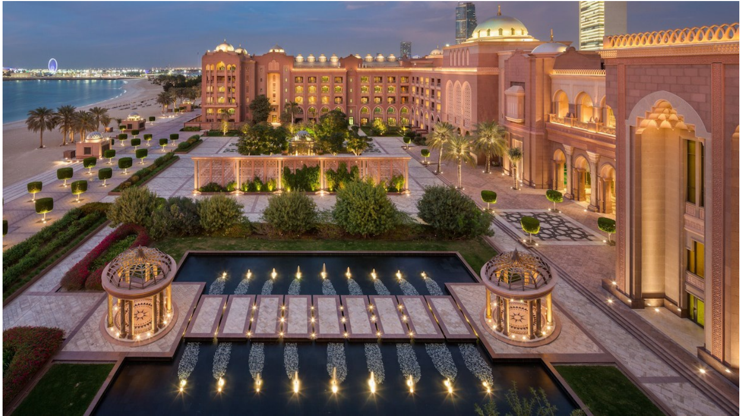
Al Ras Al Akhdar

Ein Hotel der Superlative: Eleganz, Luxus, eine herausragende Gastronomie und auf höchstem Niveau zelebrierte Gastfreundschaft.