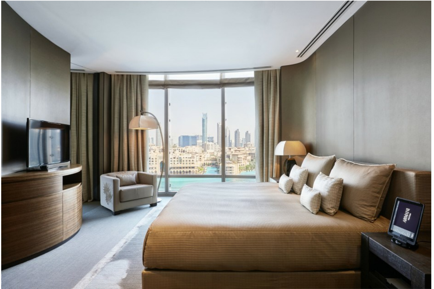
Downtown Burj Khalifa

Geniessen Sie den einzigartigen Armani Lifestyle an der ersten Adresse der Armani Hotels.