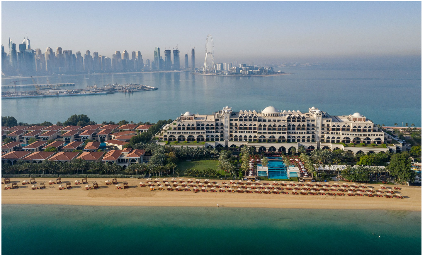
The Palm Jumeirah

Das Hotel ist äusserst prunkvoll und in erlesenem Stil eingerichtet und erinnert an das glorreiche osmanische Reich.