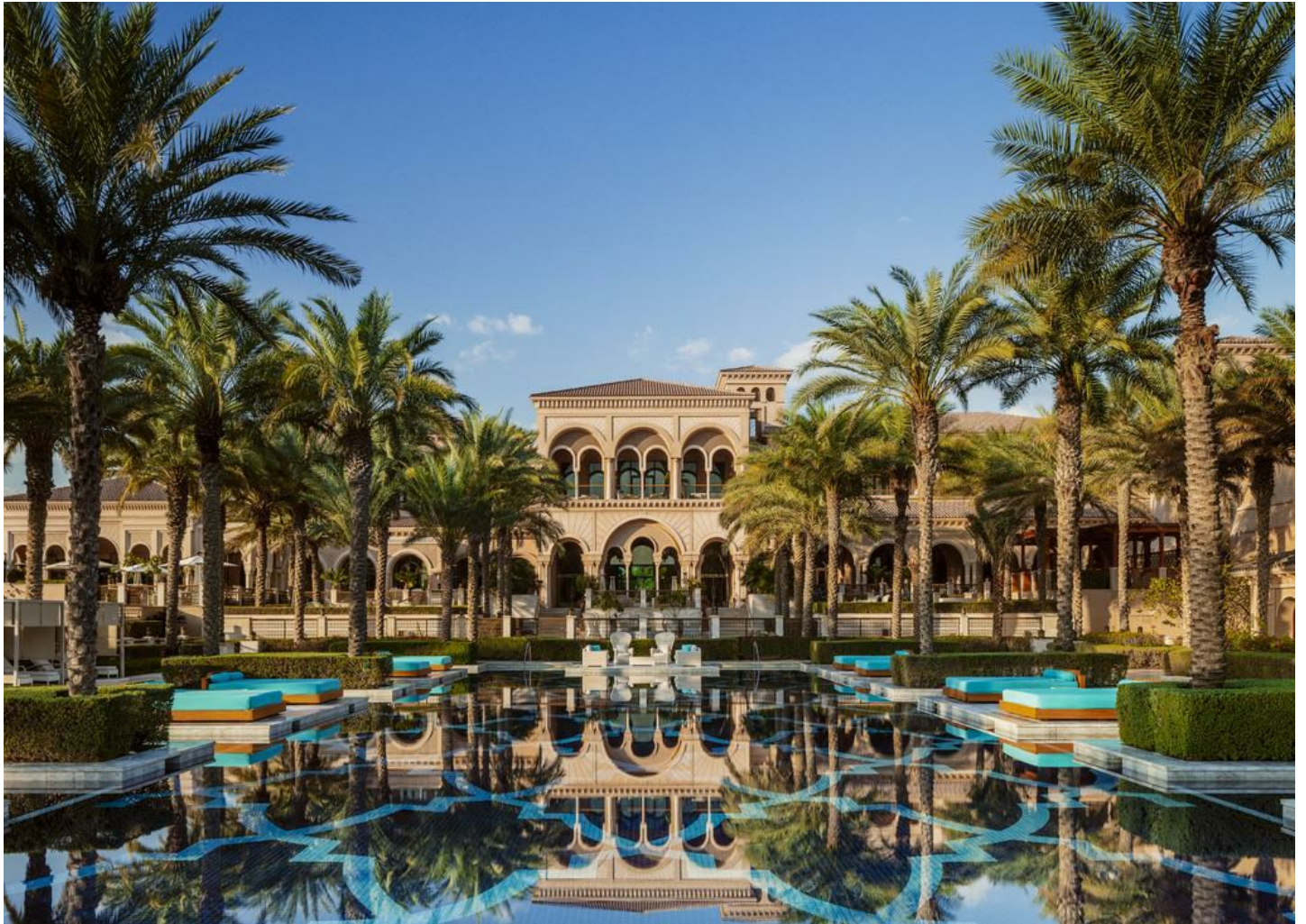
The Palm Jumeirah

Eines der attraktivsten Strandhotels auf der Palmeninsel in Dubai, mit gleichzeitiger Stadt- und Meersicht - und dazu die ganz spezielle One&Only- Atmosphäre.