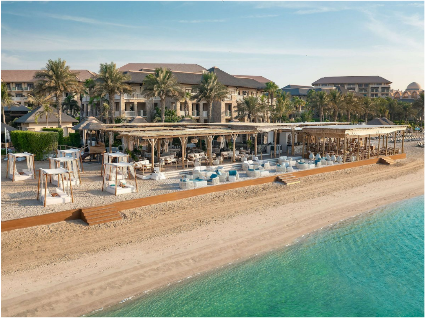
The Palm Jumeirah

Das Luxushotel verspricht polynesisches Inselambiente, kombiniert mit zuvorkommender Gastfreundschaft in ruhiger und erholsamer Umgebung.