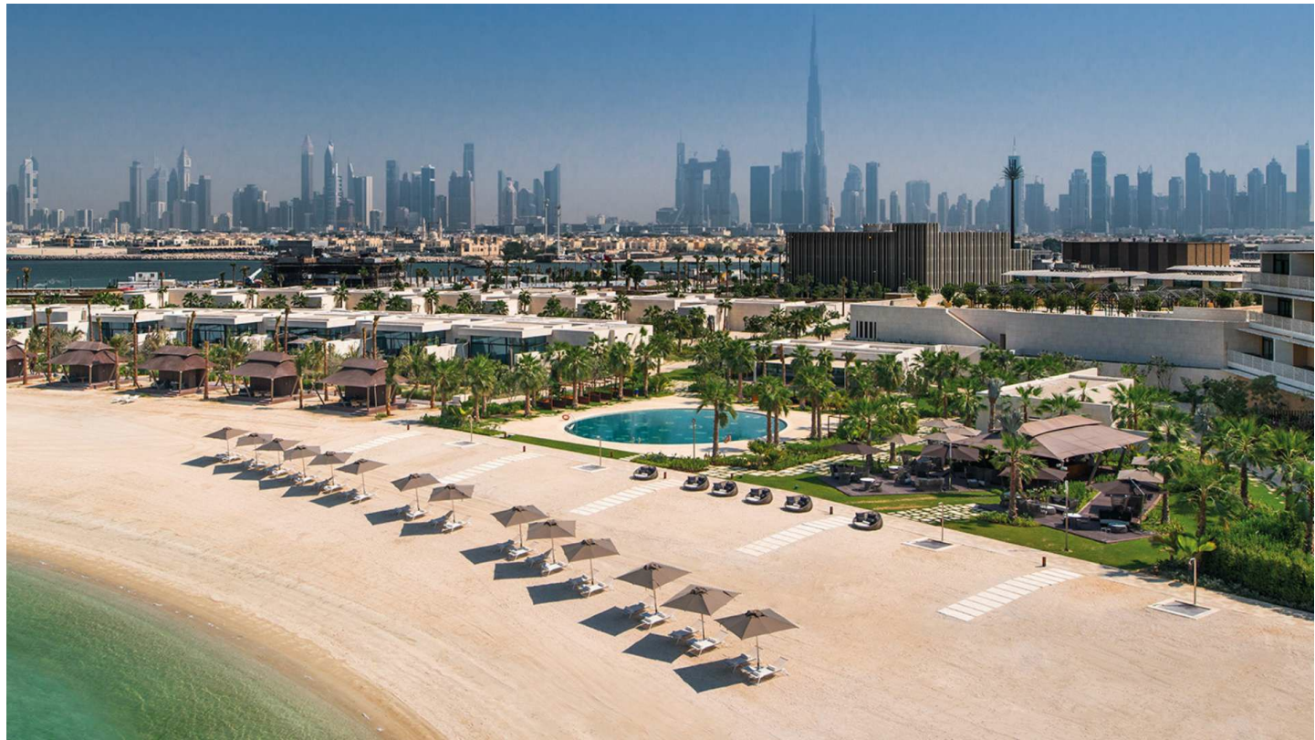
Jumeira Bay Island

Das Bvlgari Resort ist das neue Juwel der Luxusgastronomie-Kollektion. Die exklusive Lage bietet eine echte urbane Oase für Gäste.