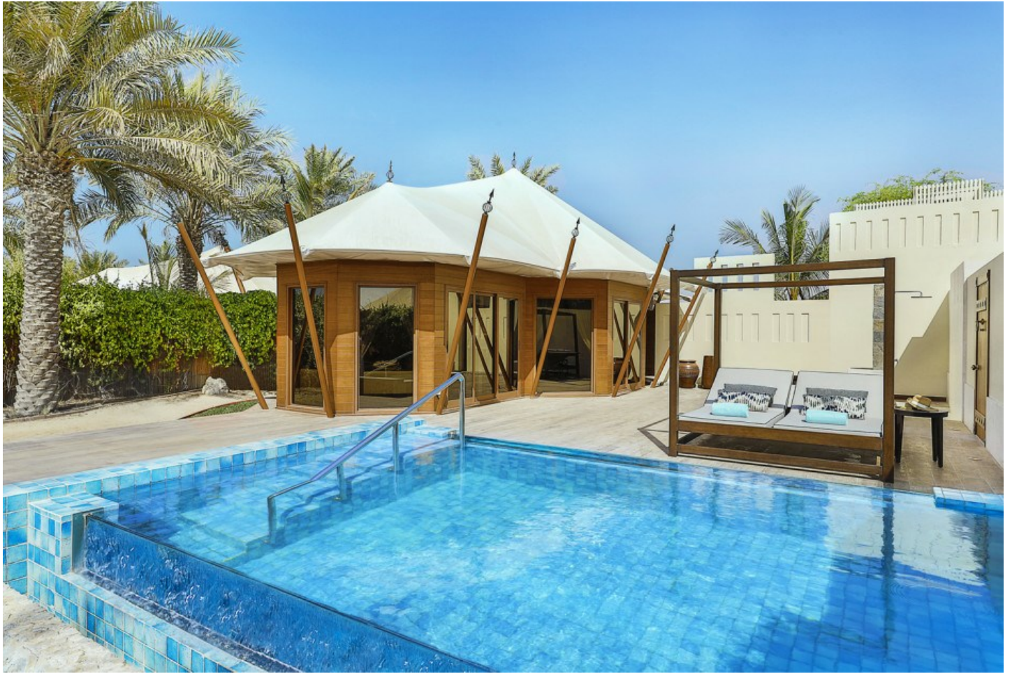
Al Hamra Beach

Erleben Sie romantische Tage wie aus 1001 Nacht! Das neue Ritz-Carlton ist eines der exklusivsten Strandresorts der Region.