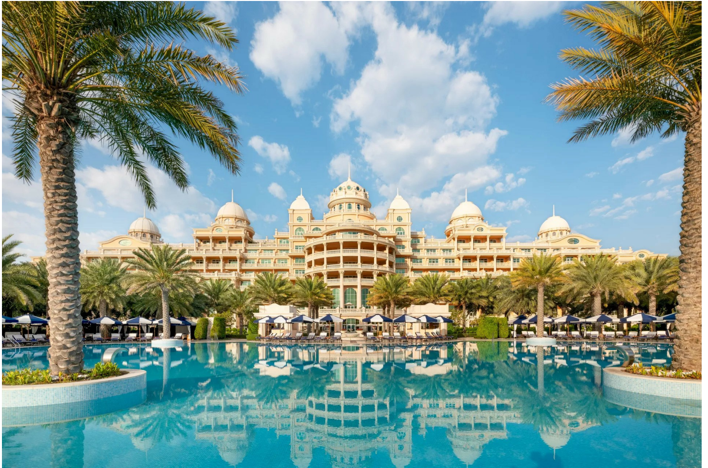
The Palm Jumeirah

Das Raffles The Palm besticht durch seinen exquisiten Komfort, die tolle Strandlage und das kulinarisch hochstehende Angebot.